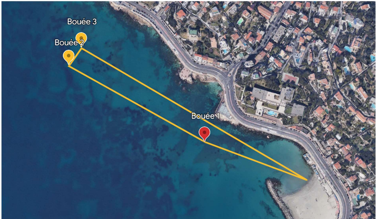
Plan du 1000m - La Villa Gaby